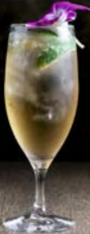
サルトガクーラー