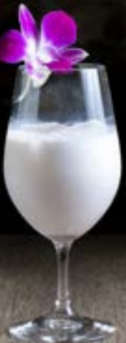
ロイヤルリッチミルク