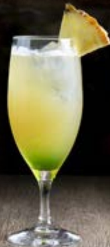
カナリアキャンディー