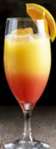
オレンジサンライズ