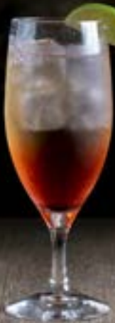
シャーリーテンプル