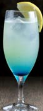
ブルーティアーズ